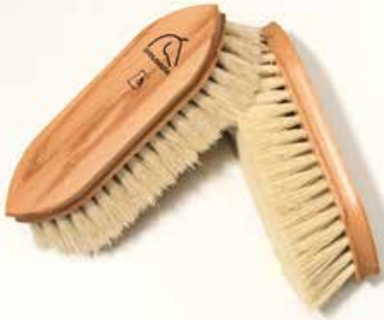
TS Staubbürste – mit einer Borstenlänge von 42 mm exklusiv für procallo gefertigt